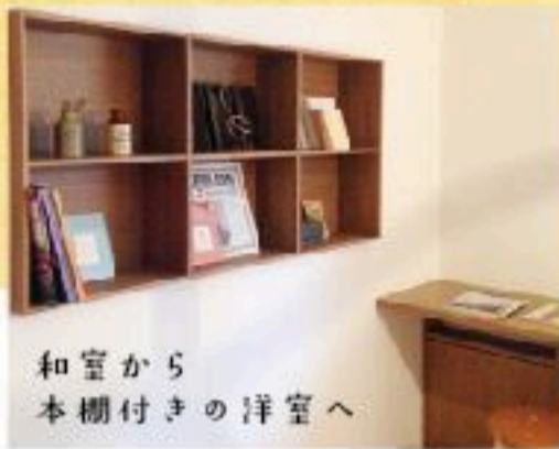
和室から 本棚付きの洋室へ